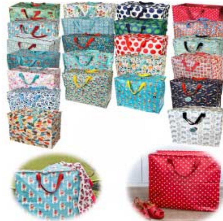
Abb. exemplarisch - diverse Muster