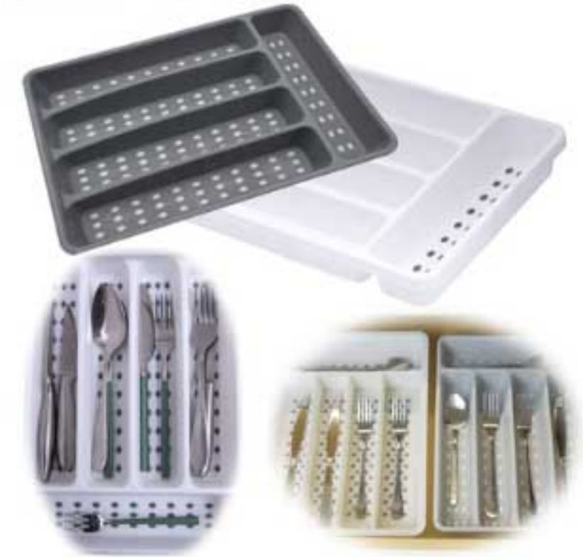
• Musterabbildung | diverse Farben

Praktischer Schubkasteneinsatz ✓ PP-Kunststoff ✓ Weiß oder Grau ✓